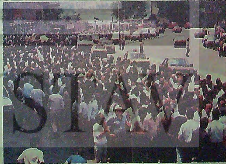
HARB-İŞ'e bağlı tersane işçilerinin girişimleriyle başlayan birleşik eylemler, kamu işçilerinin giderek artan katılımıyla sürüyor..

Yalnızca İstanbul, Bursa gibi büyük kentlerde değil, Balıkesir, Siirt, Diyarbakır, Batman ve Türkiye'nin dört bir yanın (Devamı sayfa 9'da)